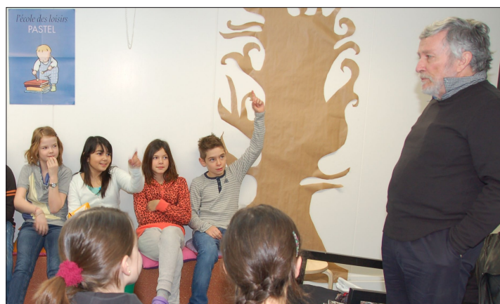
L'auteur québécois n'a pas eu à insister pour susciter la participation de ses jeunes lecteurs imériens!

Renseignements : Velo Nell'O, Place du Marché 1, 2610 St-Imier, tél : 032 / 941 28 20