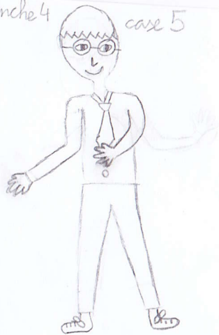
planche 4 case 5