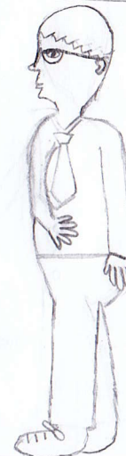
Planche 4, case 4

4 L'enseignant a des feuilles dans la main et marche dans la classe.