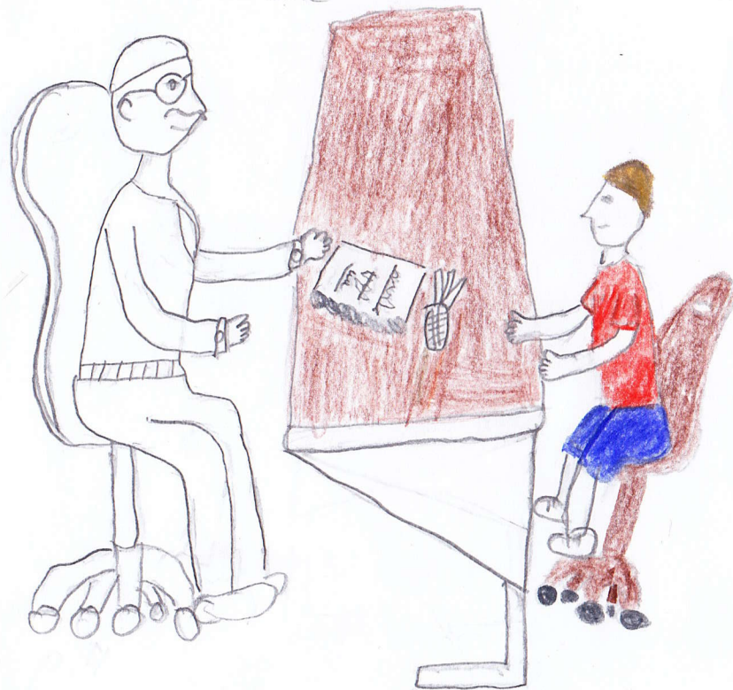
Planche 5 case 4