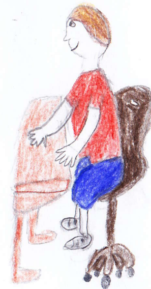
Planche 5 case 2

2 Marc est à nouveau assis à son bureau. Il fait le test.