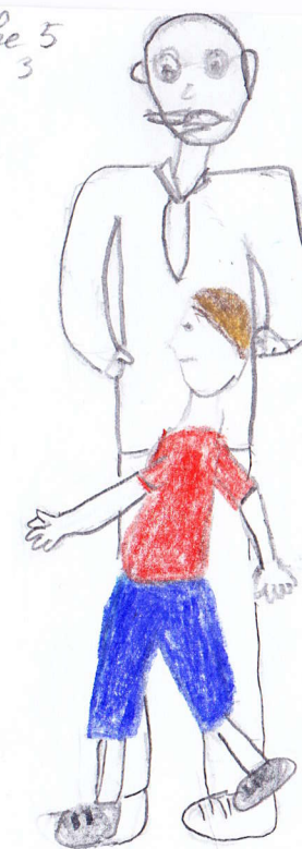
Planche 5 case 3

2 Marc est à nouveau assis à son bureau. Il fait le test.