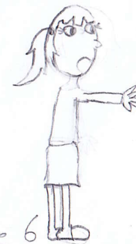
planche 1 case 6.

2 Le prof écrit le calcul très difficile au tableau.