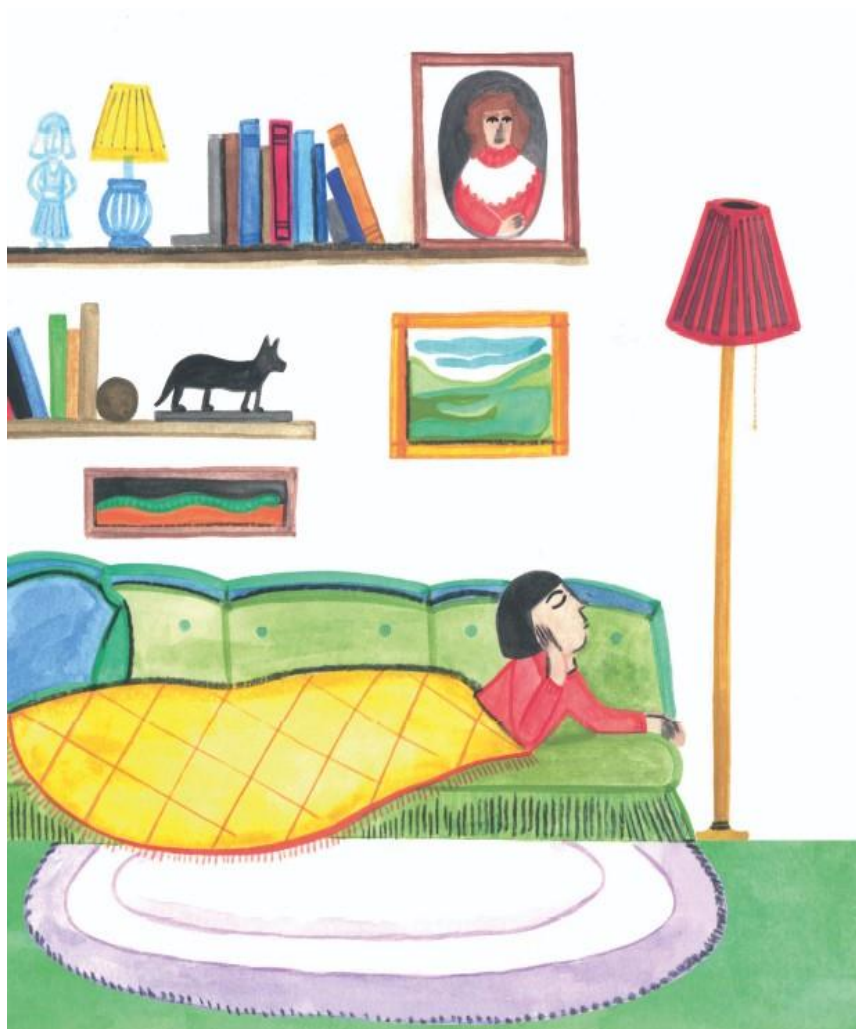
Ma blanche colombe, 1937, le bombardement de Guernica, illustrations Sophie Daxhelet, éditions Kilowatt