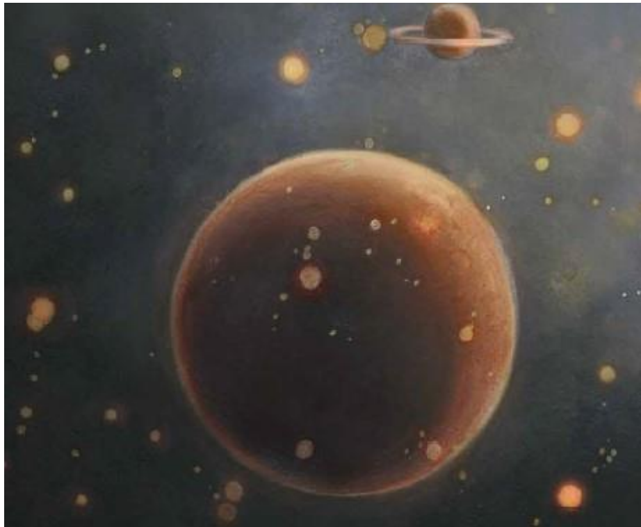
Passage secret, illustrations Chiara Arsego, éditions Les p'tits bérêts

Sur ce je vous embrasse, mes chères plumes en herbe et vous laisse à vos lectures ! A bientôt !